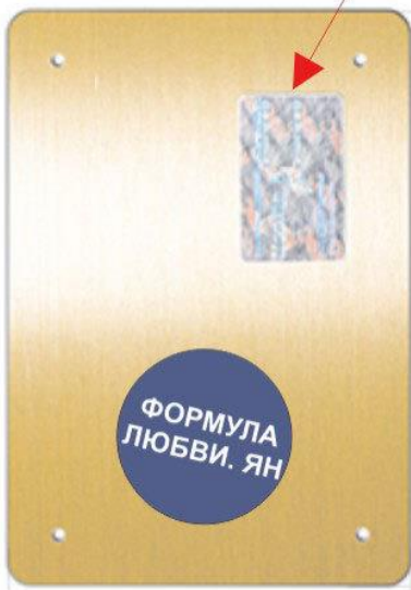
Plaque 4 trous